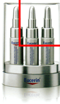
Neu: Eucerin® Hyaluron-Filler Serum-Konzentrat – 6 x 5 ml